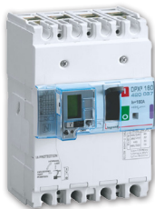
Puissance 3 : une offre complète et inédite

2011 a également été marquée par le lancement réussi de l'offre Puissance 3 en France, une gamme complète de produits permettant d'optimiser la performance à toutes les étapes de la vie d'un tableau électrique. Produits phares de cette gamme, les disjoncteurs DPX 3 proposent des solutions de protection intégrant par exemple la mesure et le pilotage à distance des consommations d'énergie.