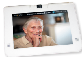
Tablette communicante Visiovox d'Intervox.

Autre exemple : le rachat d' Intervox Systèmes , leader des systèmes pour téléassistance en France, permet à Legrand de devenir n°1 français des systèmes électriques dédiés à l'assistance à l'autonomie, un marché en pleine expansion soutenu à la fois par une demande grandissante de la part des seniors qui souhaitent majoritairement rester à leur domicile, et par les pouvoirs publics qui encouragent cette démarche face à la forte augmentation démographique de cette classe d'âge.