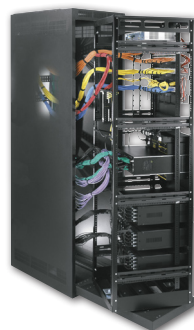
Armoire vidéo Middle Atlantic Products.

Legrand a réalisé depuis le début de l'année 5 opérations de croissance externe, totalisant un chiffre d'affaires annuel de plus de 200 M€, poursuivant ainsi sa stratégie d'acquisition autofinancée et ciblée.