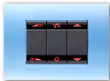
Living & Light : une révolution design et technologique

Début 2011, les nouvelles gammes d'appareillage Living & Light ont révolutionné l'offre Bticino en Italie pour le tertiaire et le résidentiel avec un contenu technologique très innovant : moteur hautement performant, solutions électroniques d'économies d'énergie, intégration de la technologie radio Zigbee, nouvelles fonctionnalités... Living & Light, c'est aussi un design très contemporain avec des lignes minimalistes, une grande variété de finitions et des matières nouvelles, de la soie au plastique translucide.